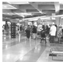
VISITAS. Unos tres millones de personas visitan mensualmente el Subcentro, y sólo un tercio son usuarios del Metro, señaló Corbo.

Según Corbo, la inauguración de la extensión de la Línea 1 hacia Los Dominicos y la descongestión que se produjo en la estación terminal, no influyó en sus ingresos. "En general, los flujos de visitas nuestros que provienen del Metro bajaron