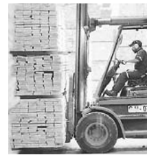
PRODUCCION. Esta planta actualmente tiene un consumo de 564.000 metros cúbicos sólidos al año de rollos aserrables y el objetivo es aumentar la producción.

Esta planta actualmente tiene un consumo de 564.000 metros cúbicos sólidos al año de rollos aserrables y el objetivo es aumentar la producción lo que, a su vez, incrementará